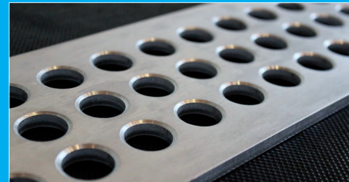
Unser stabiles Alu-Netz mit Rundlochung für TÜV-geprüfte Sicherheit